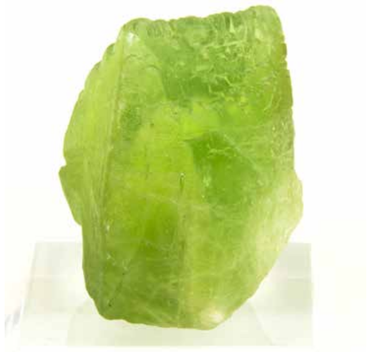
Péridot du Pakistan. Coll. particulière

Connues depuis des siècles, certaines de ces pierres, comme le péridot, sont rapportées en Europe dès le 12 e siècle, à l'époque des croisades et décorent encore les églises médiévales.