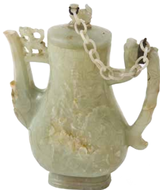
Théière en jade néphrite. Coll. Musée d'art et d'histoire, La Rochelle