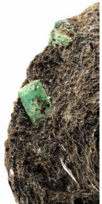
Émeraude sur schiste micacé, Égypte. Coll. Muséum de Nantes