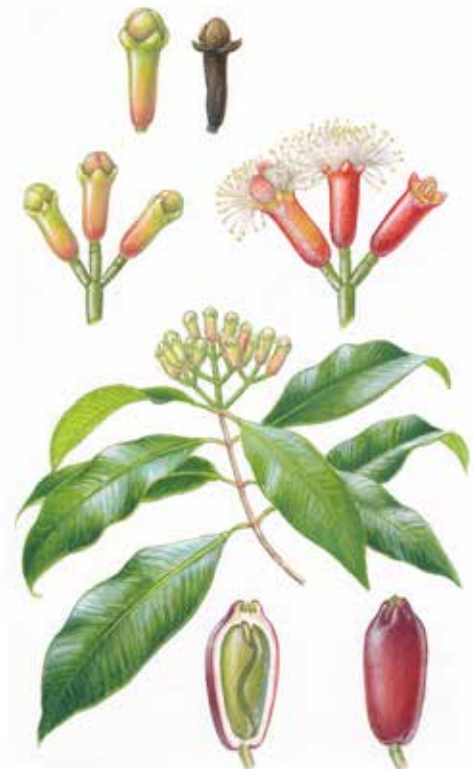
Noix de muscade et clou de girofle. Ill. Julien Norwood