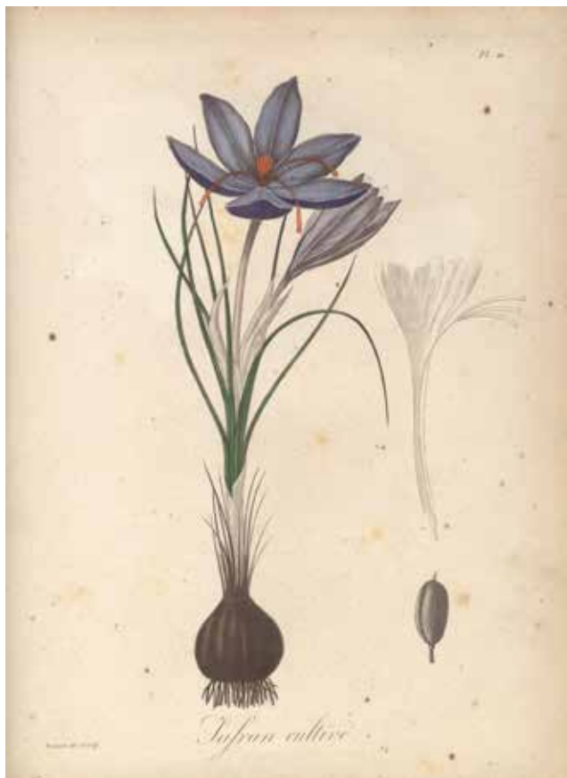
Saffran cultivé. Planche extraite de Pythographies médicales - ROQUES. Coll. Fonds ancien de la bibliothèque scientifique. Muséum de Nantes

Enfin, l'île de Zabargad, située dans la mer Rouge, est connue depuis l'Antiquité pour ses gisements de péridot.