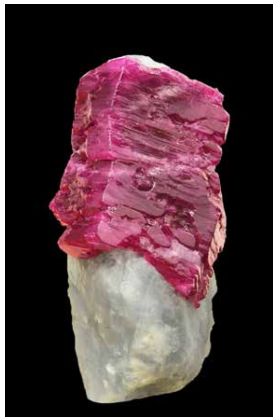
Rubis de 1 700 carats « King of Mogok ». Coll. Particulière

Les bijoux birmans sont alors transportés d'est en ouest vers les cours des maharajas, des sultans, des empereurs et des rois. Aujourd'hui encore, ils alimentent les plus luxueuses bijouteries du monde.