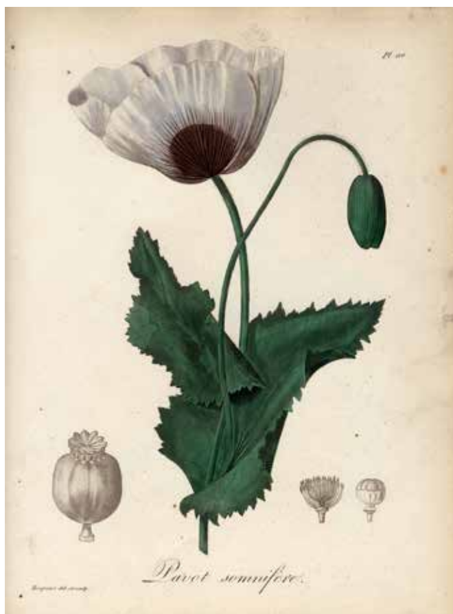
Pavot somnifère. Planche extraite de Pythagories médicales - ROQUES.