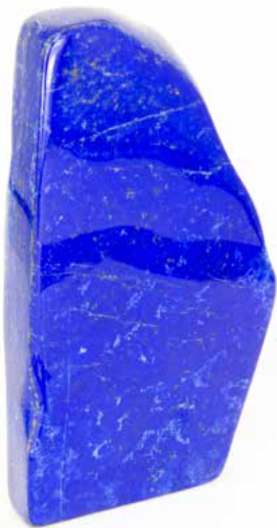
Lapis-lazuli, Afghanistan. Coll. Particulière

Sur le territoire de la Perse antique, l'ancienne cité Bactres, en Afghanistan, et la ville de Téhéran, en Iran, se situent sur le chemin des caravaniers de la route de la soie. Montagnes impénétrables, plateaux désertiques, climats extrêmes, l'Afghanistan est une véritable forteresse naturelle dont les richesses minérales sont exploitées depuis l'Antiquité. Encore aujourd'hui, ce pays reste le principal fournisseur d'une pierre ornementale très prisée : le lapis-lazuli, dont le gisement le plus connu est la mine de Sar-e-Sang, à 3 000 m d'altitude. C'est également sur ce territoire que le précieux pavot à opium est repéré dès le 13 e siècle par Marco Polo, dans le corridor du Wakhan, situé dans les hauteurs des montagnes de l'Hindu Kush, entre le Tadjikistan, le Pakistan et la Chine. Plus à l'ouest, au nord de l'Iran, dans la région du Khorassan, sont extraites les plus belles turquoises du monde.