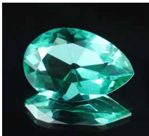
Répliques de diamants célèbres. Coll. Musée de minéralogie, MINES, Paris-Tech