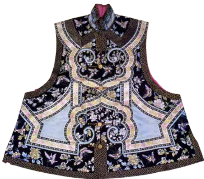
Tunique de femme en soie, dite «tunique aux papillons ». Coll. Musée de la Compagnie des Indes de la Ville de Lorient

Jade, prince incontesté des bijoux et sculptures délicates, thé vert, issu des feuilles du Camellia sinensis , badiane de Chine ou anis étoilé, utilisé depuis 3 000 ans en médecine et en cuisine, poivre de Sichuan, cultivé depuis des siècles et entrant dans la composition du mélange cinq-épices sont autant de richesses naturelles ayant parcouru les routes caravanières de l'Asie centrale et du Moyen-Orient pour parvenir jusqu'à nous.