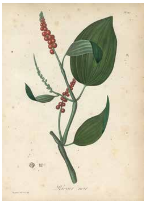
Poivrier noir. . Planche extraite de Pythographies médicales - ROQUES. Coll. Fonds ancien de la bibliothèque scientifique. Muséum de Nantes

Dès l'Antiquité, ces épices sont connues des Grecs et des Romains, grâce aux routes terrestres et maritimes reliant l'Inde à l'Occident. Au 15 e siècle, ces routes sont fermées par la conquête ottomane : les Européens se tournent alors vers l'océan. Les Portugais sont les premiers à atteindre l'Inde en contournant l'Afrique. C'est dans cette dynamique que sont créées, 150 ans plus tard, les compagnies des Indes orientales motivées par le monopole du commerce des épices et des pierres précieuses.